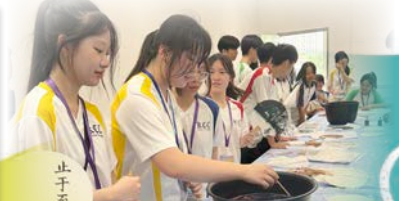
同學們用心製作漆扇，享受中華文化交流活動帶來的樂趣。