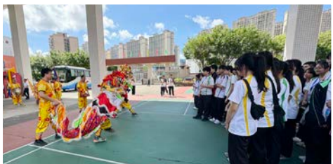
惠陽區第一中學（高中部）表演非物質文化遺產——麒麟舞，熱烈歡迎我校師生到訪。