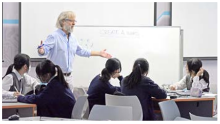
外籍英語教師與學生進行課後英語支援活動

逢周三，全校進行英語早會，以校園電視台型式進行，由多位外籍英語教師帶領學生進行不同的英語活動，如全校朗讀英文篇章、英語專題介紹等。外籍英語教師以小組形式，舉辦一系列課後英語支援活動，透過互動和趣味的方式，與各年級的學生進行英語會話練習，以協助學生衝破運用英語的心理障礙。高年級亦透過舉辦聯校英語口語訓練，加強學生的應試技巧。此外，學校規定早讀課時段學生必須閱讀英文讀本或篇章，而「閱讀計劃」亦要求學生必須完成指定的英文閱書量，這些措施有效增強學生的英語閱讀能力。