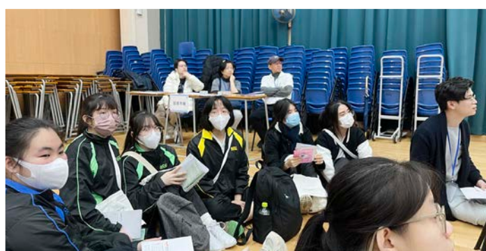
升輔學長積極參與模擬人生遊戲