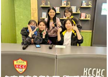
各班代表參與午間「好歌送給您」及正向打氣活動

同學在精彩的中學生活裏，透過各式各樣的學習經歷，建立自信心、正確價值觀念及多元才能。