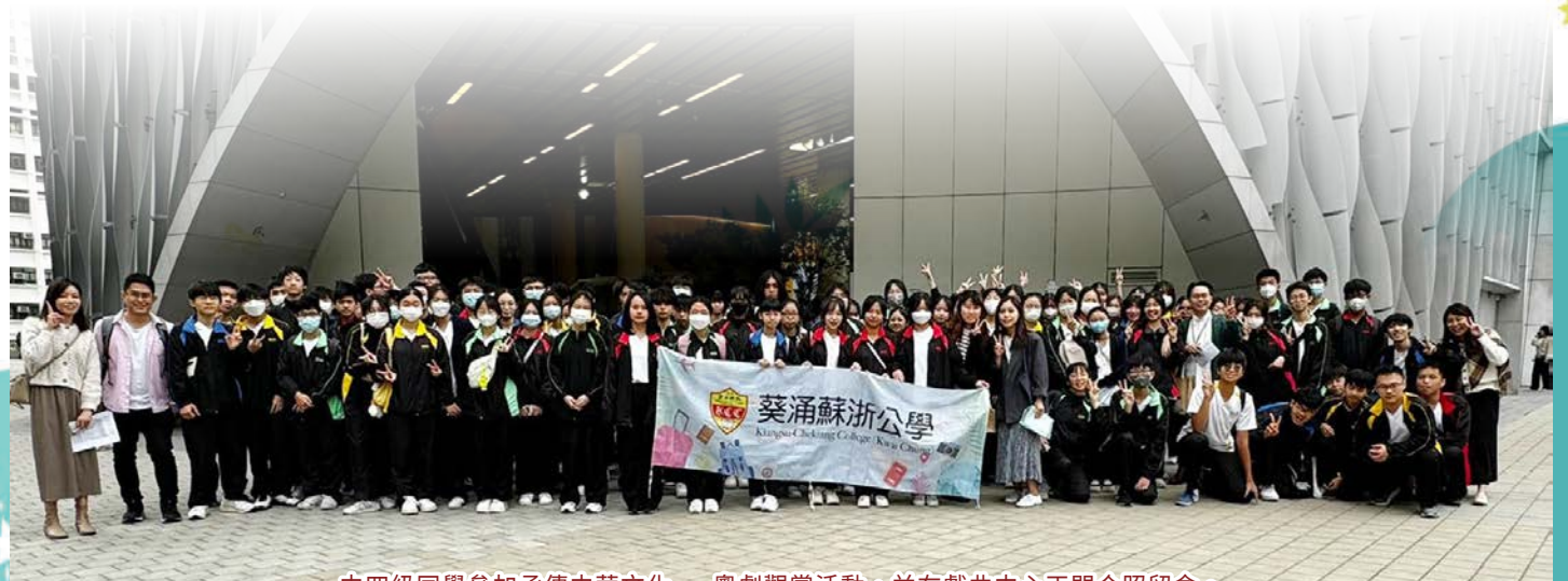
中四級同學參加承傳中華文化——粵劇觀賞活動，並在戲曲中心正門合照留念。