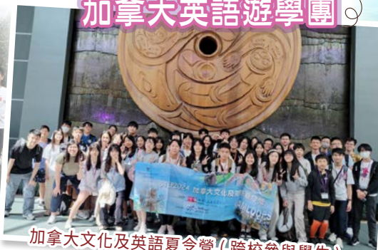
加拿大文化及英語夏令營(跨校參與學生)