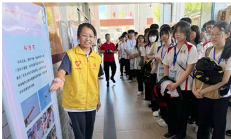
惠陽一中朗誦及演講學會的同學為我校簡介校園生活及課外活動情況