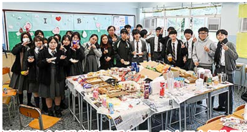
各班透過班會活動營造關愛氛圍，建立正向師生關係。