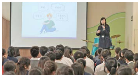
本校為同學安排講座，向學生灌輸守法知規等價值觀念。