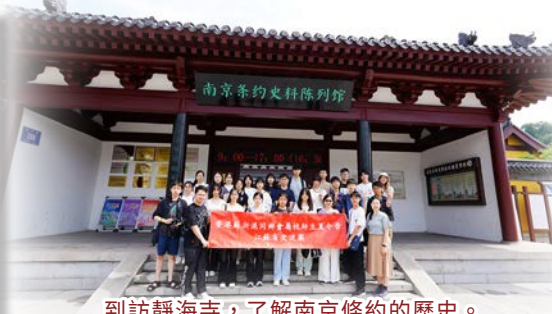
到訪靜海寺，了解南京條約的歷史。