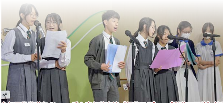
青少年眾樂隊在 'Steam' 愛心嘉年華表演《煙花三月》、《梨花又開放》等樂曲