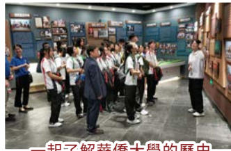
一起了解華僑大學的歷史