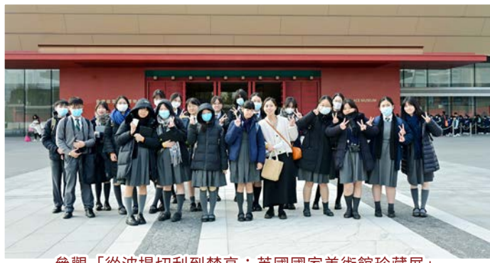
參觀「從波提切利到梵高：英國國家美術館珍藏展」