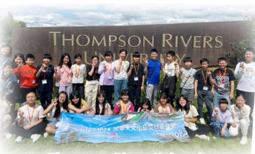
Thompson Rivers University