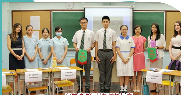
與友校進行英語辯論比賽

課外活動方面，學校特別設立英語音樂劇小組、英語辯論隊、英文校報等，讓學生在學習之餘，也可發揮個人所長。