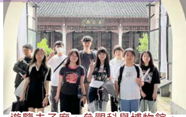
遊覽夫子廟，參觀科舉博物館。