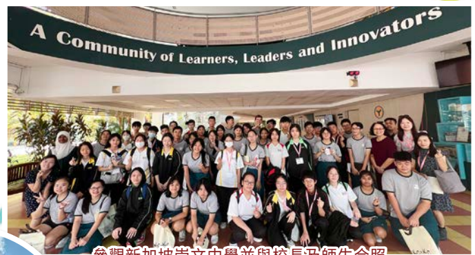
參觀新加坡崇文中學並與校長及師生合照