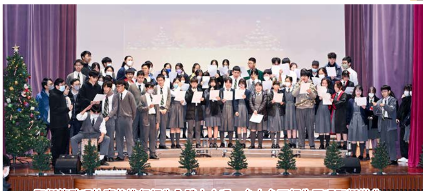
聖誕節歌唱比賽後進行師生全體大合唱，台上台下師生同唱聖誕樂曲。