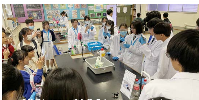
本校愛心 STEAM 嘉年華「Chemistry Wonderland」