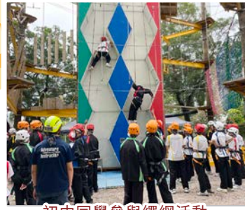
初中同學參與繩網活動，培養自信心及解難能力。