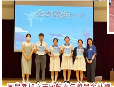
同學參加立志啟航青年獎學金計劃啟動禮，努力實現夢想。