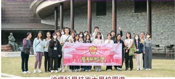
沖繩科學技術大學校園遊