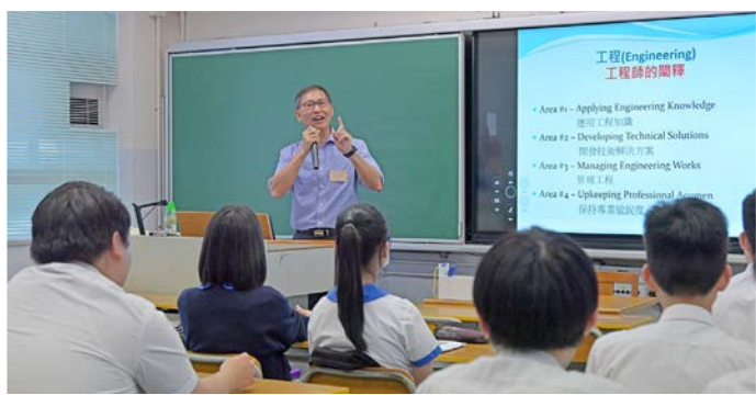
活動嘉賓與同學分享工作上的經歷

為協助學生了解各行業及籌劃未來，本校公民教育組及升輔組舉辦生涯規劃講座，共邀得十多位不同專業的成功人士到校，向同學介紹各專業現況、入行要求及發展前景，並分享其寶貴的人生經驗，解答同學對於該行業有關的疑問，以協助同學開拓人際網絡，擴闊視野，籌劃未來。是次分享增加了同學們對不同行業的認識，有助於了解相關職業在學歷及待人處事態度方面的要求。透過與專業人士交流，希望能激發同學們積極上進的鬥志，努力追求自己的理想。