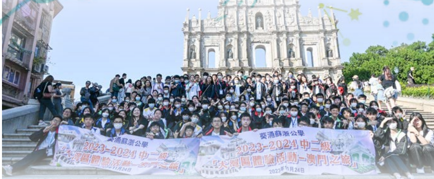
全級中二學生參與澳門考察團，於大三巴牌坊前留影。