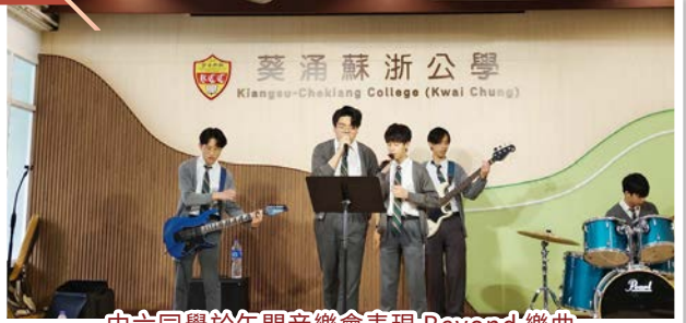
中六同學於午間音樂會表現 'Beyond' 樂曲