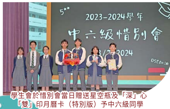
學生會於惜別會當日贈送星空瓶及「深」心「雙」印月曆卡（特別版）予中六級同學