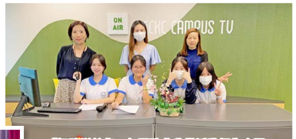
「好歌送給您」午間歌曲欣賞活動師生合照