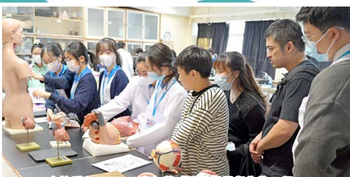
本校愛心 STEAM 嘉年華「顯微世界與生物工程」