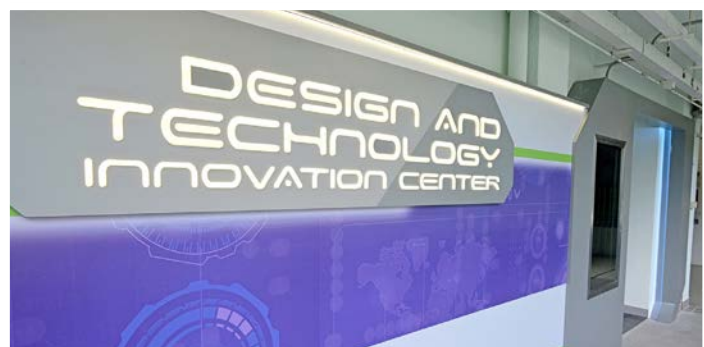
設計與科技創新中心落成