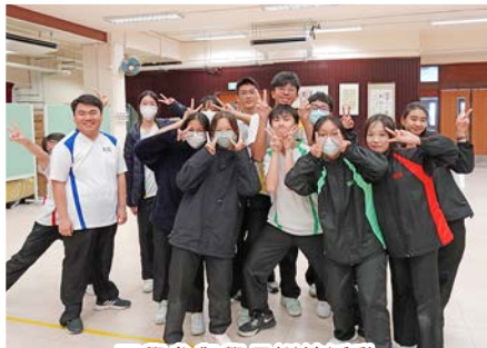
同學參與學長訓練活動