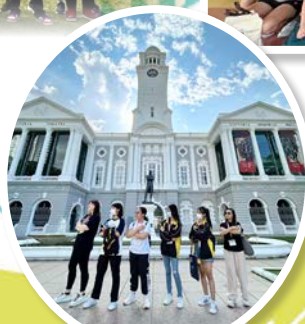
同學與萊佛士爵士同顯霸氣