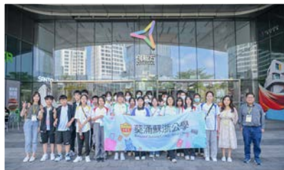
於創新方了解祖國於藝術方面發展