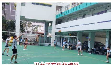
男女子高級組練習