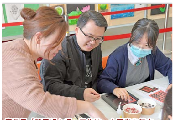
家長日「新春好心情」工作坊，大家樂在其中。