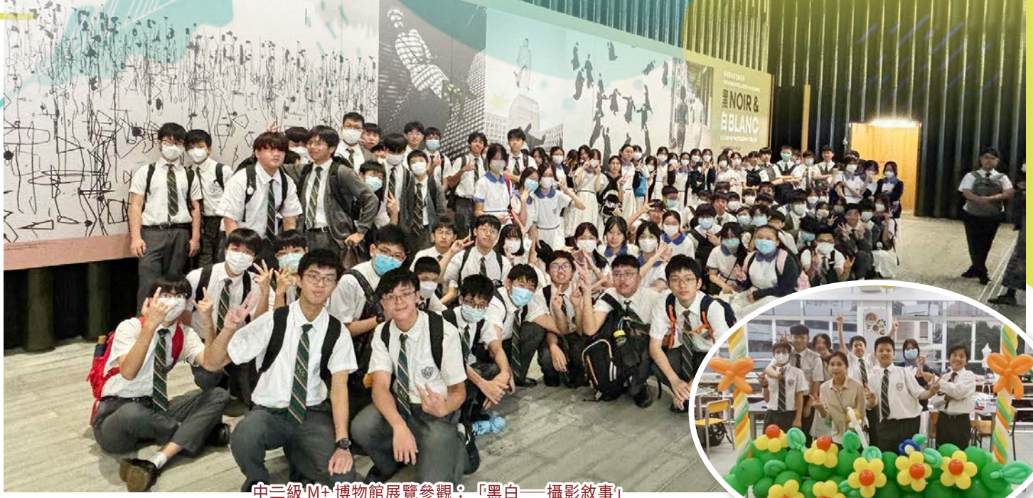
中三級 M+ 博物館展覽參觀：「黑白——攝影敘事」