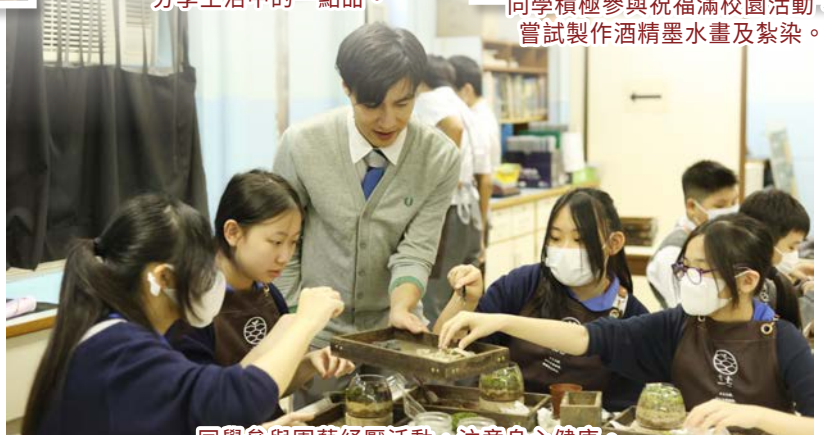
同學參與園藝紓壓活動，注意身心健康。