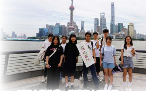
到達上海外灘，遠眺東方明珠塔。