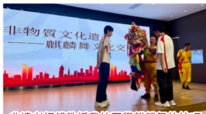
非遺老師傅教授我校同學麒麟舞的技巧