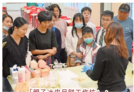
「親子冰皮月餅工作坊」，讓同學享受自製食物的樂趣。