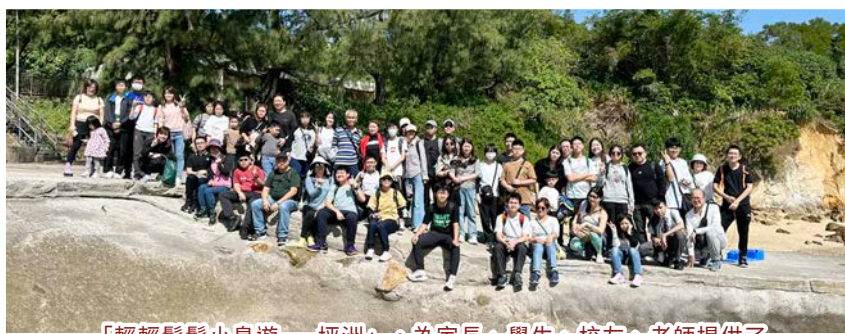
「輕輕鬆鬆小島遊——坪洲」，為家長、學生、校友、老師提供了一個難得的機會，親身體驗這片寧靜土地的美麗和自然環境。