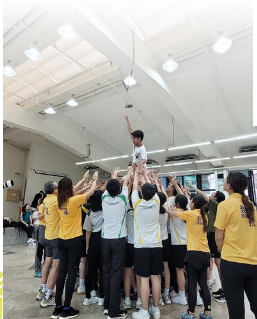
同學透過歷奇活動，學習迎接挑戰及建立團隊精神。