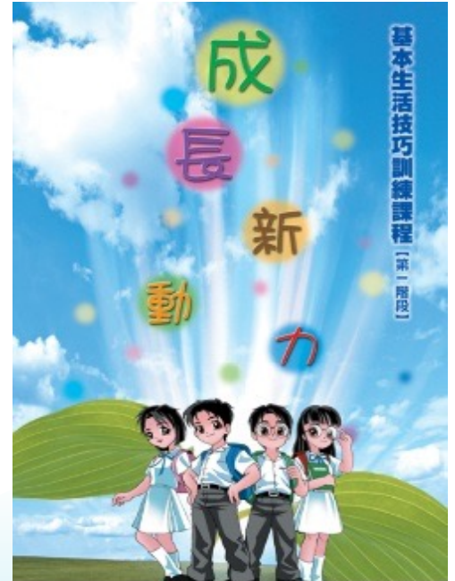
成長新動力課程有完整的教材配合

本校與衛生署合辦之「成長新動力」課程，特為中一至中三同學安排生活技巧訓練，如提升他們處理情緒、壓力的方法，加強與人溝通的能力，與朋輩相處的技巧，認識煙、酒及濫用藥物的禍害，以及抗拒引誘的方法，使他們健康成長。