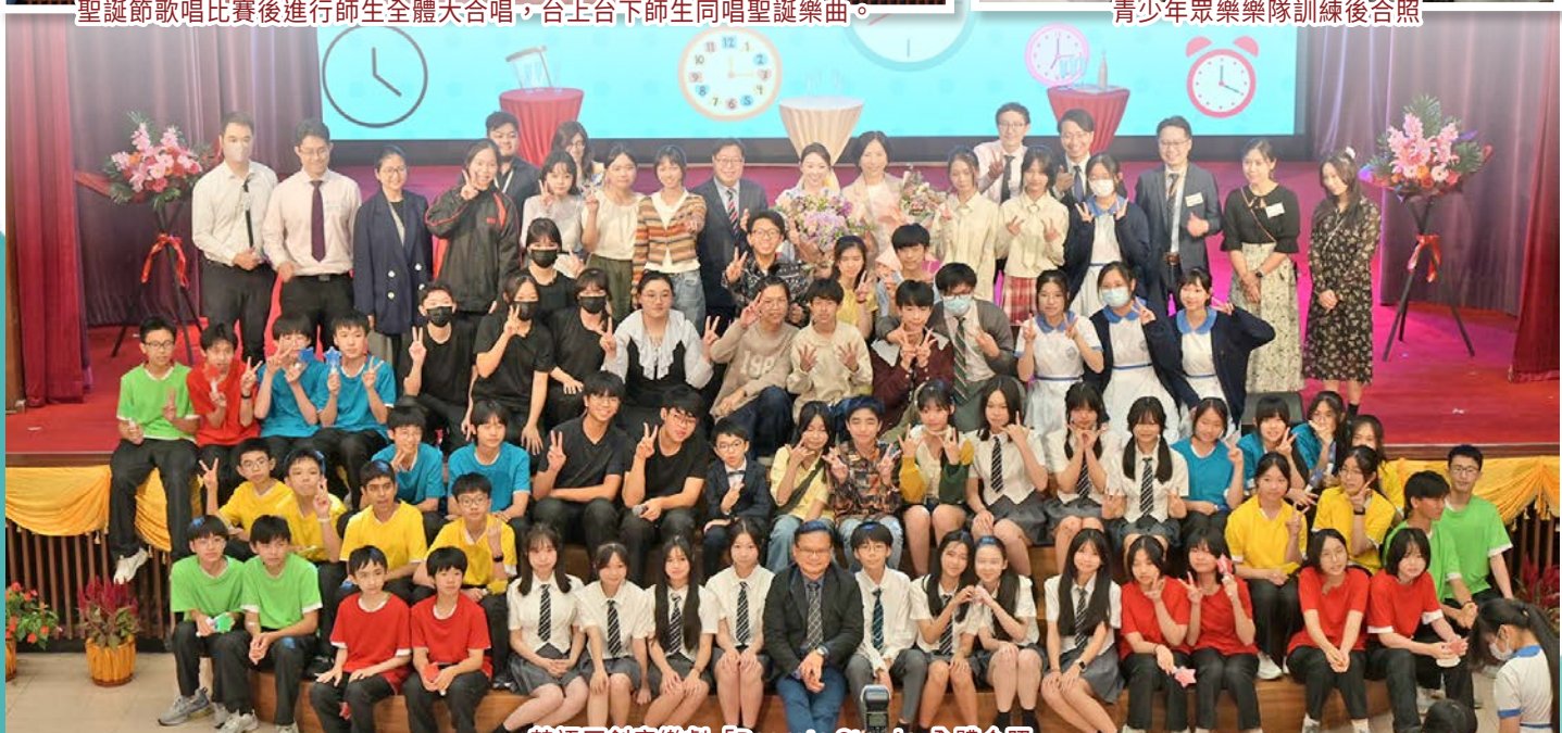
英語原創音樂劇「Regrets Stop!」全體合照