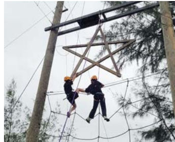
高中同學參加成長挑戰日營，鍛鍊身心及學習以正面心態面對困難。