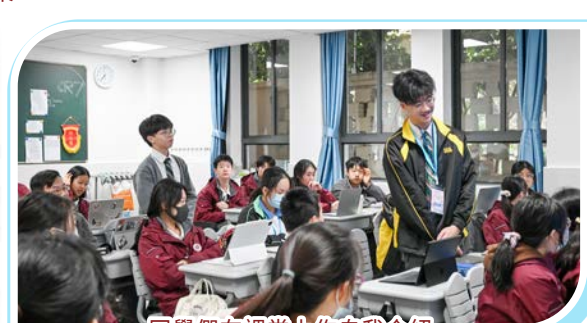
同學們在課堂上作自我介紹