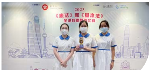
本校同學參加 2024 年《憲法》和《基本法》全港校際問答比賽，獲最積極參與獎。

本校為同學安排多元學習經歷，讓同學改進成績的同時，明白建立良好品格、正確價值觀念的重要性。