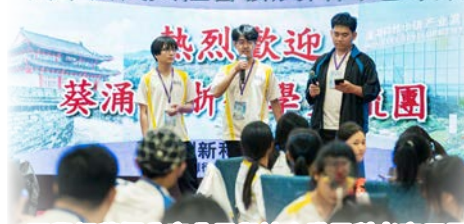
同學們積極分享公民與社會發展科考察反思