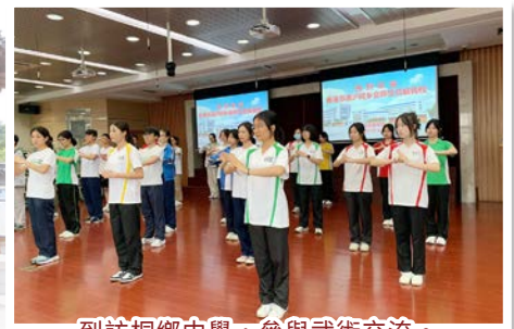
到訪桐鄉中學，參與武術交流。