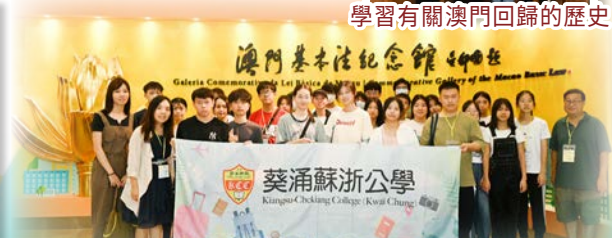
於澳門學習基本法知識