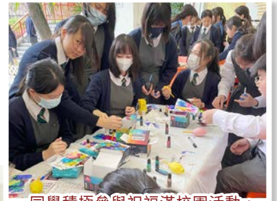
同學積極參與祝福滿校園活動，嘗試製作酒精墨水畫及紮染。