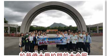
於華僑大學校門前大合照