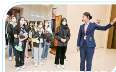
同學們認真聆聽導賞員介紹 中共一大紀念館

在課餘時間,學生參觀了中共一大紀念館,認識國家歷史事件,感受國家的崢嶸歲月。此外,學生還遊覽田子坊、豫園、南京路步行街、黃埔外灘及上海書城,欣賞上海中西交融、新舊融合的建築風格,體會上海獨特的城市氛圍和深厚的文化底蘊。短短數天的行程,同學們能開拓視野,獲得珍貴的友誼,相信此趟旅程定必成為他們中學生活的寶貴回憶。