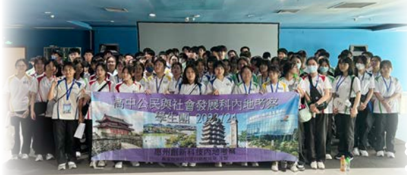
到伯恩光學有限公司參觀