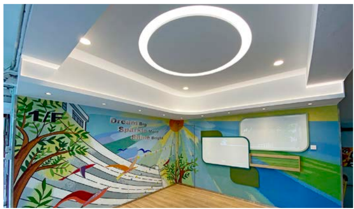
一樓的馬賽克特色牆美化項目