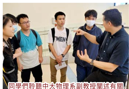
同學們聆聽中太物理系副教授闡述有關 CERN 的大型強子對撞機(LHC)的運作