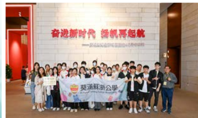
同學於珠海規劃展覽館學習國家歷史