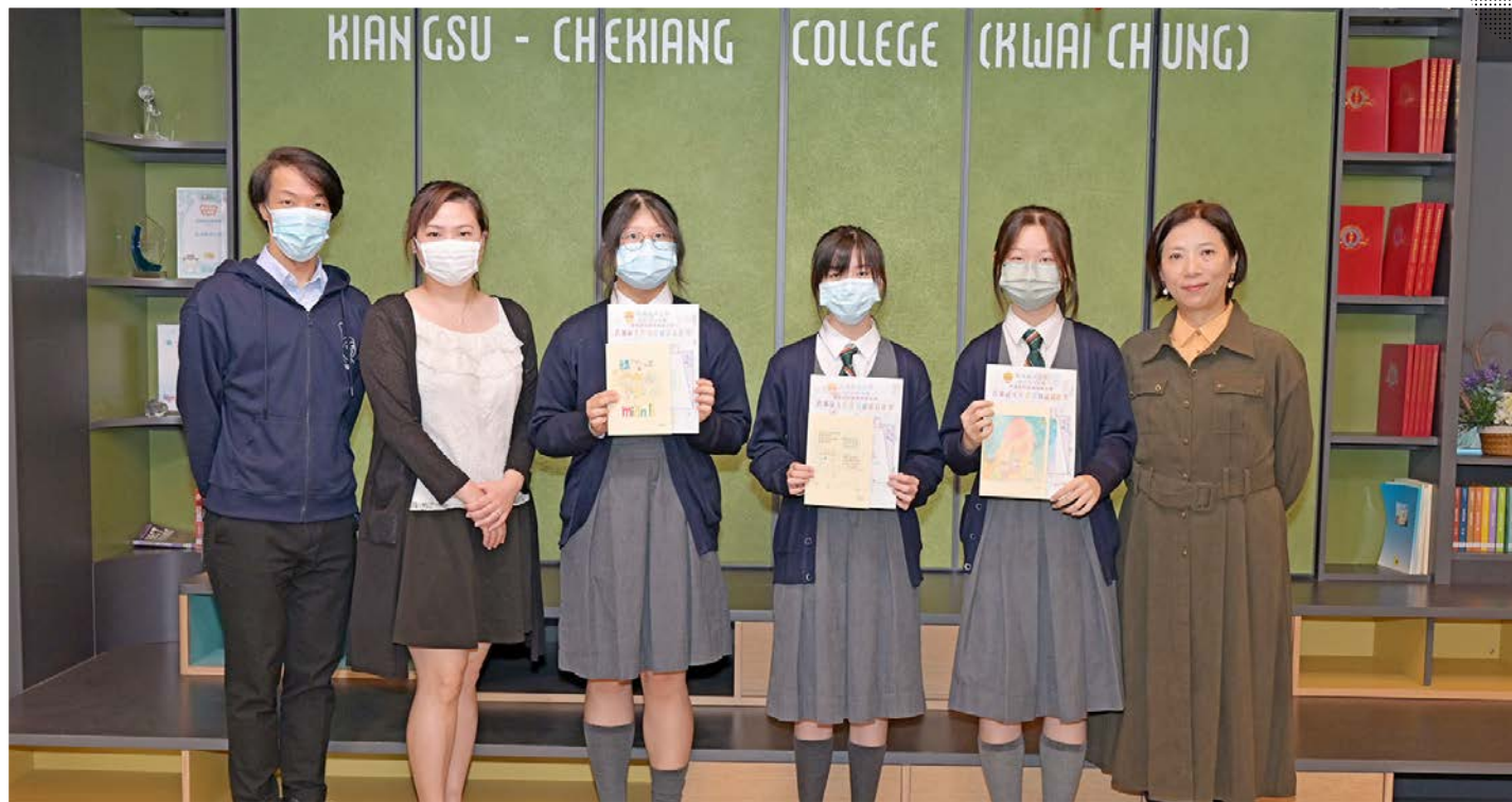
與德育組合辦普通話文件夾封面設計比賽得獎同學