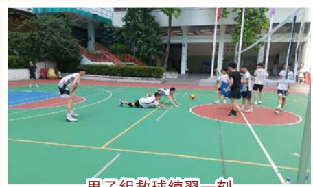
男子組救球練習一刻