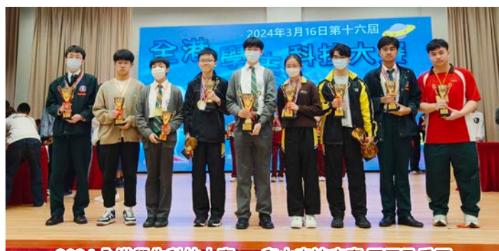
2024 全港學生科技大賽 — 爬山車速度賽冠軍及季軍