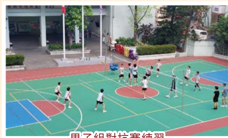
男子組對抗賽練習