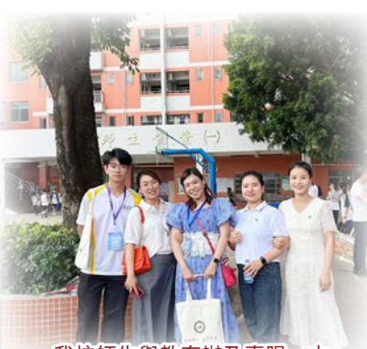
我校師生與教育辦及惠陽一中（高中部）老師們交流後留影。