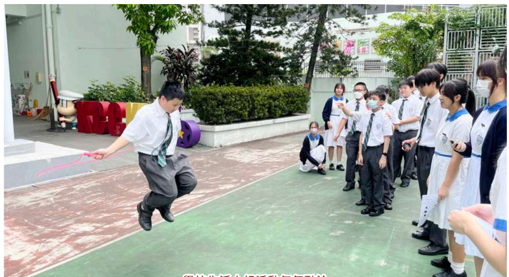
學校生活小組活動氣氛融洽

這是每周舉行的定期活動，由老師及學長帶領同學進行不同形式的小組活動。這活動不但讓學生學會與人相處的技巧，啟發他們的創意，還為他們提供展現才華的機會，締造愉快融洽的校園生活，提升他們的自信以及對學校的歸屬感。