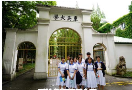
到訪參觀蘇州大學