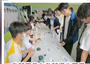
升輔學長在升輔週為同學舉辦攤位遊戲