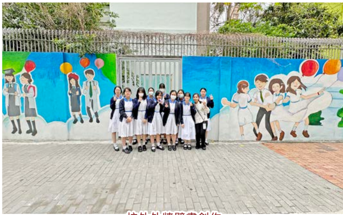
校外外牆壁畫創作