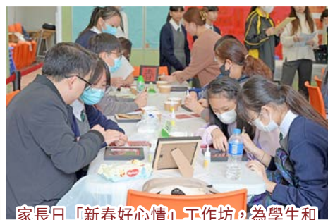
家長日「新春好心情」工作坊，為學生和家長提供一起參與的機會，加強彼此之間的連結。