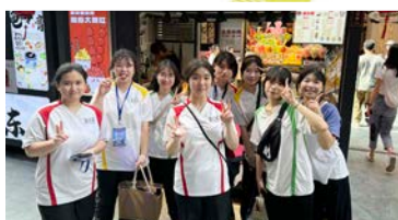
同學們遊覽當地著名的水東街，品嚐地道小吃。