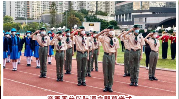
童軍團參與陸運會開幕儀式