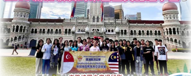
吉隆坡獨立廣場留影