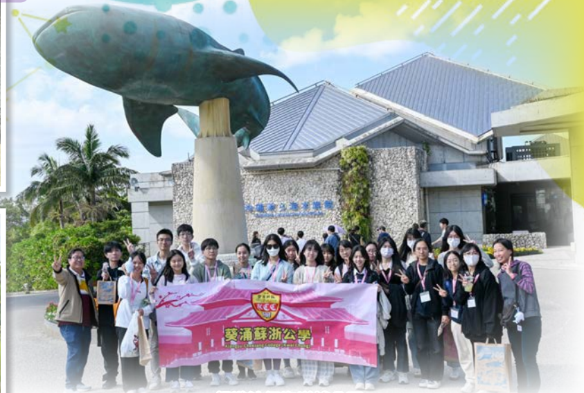
暢遊沖繩海洋博公園