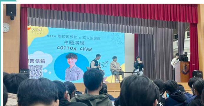
YouTube 人氣影片創作者 Cotton Chan 分享其追隨夢想和成為創作者的經歷

活動中學長們能透過一位 YouTube 人氣影片創作者 Cotton Chan，了解他的工作、如何追隨其夢想和成為創作者的經歷。學長們亦能從他的分享中得到激勵，往後努力不懈追尋夢想。