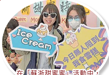
在「蘇浙甜蜜蜜」活動中，老師及學生一起品嚐冰淇淋，分享生活中的一點甜。