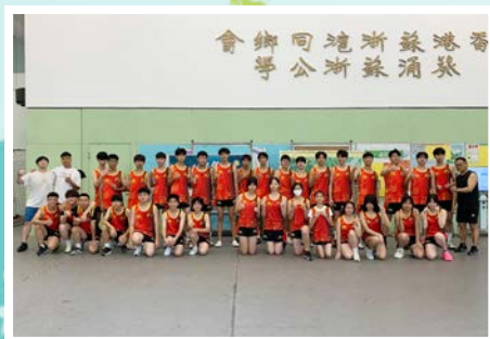
會鄉同地新蘇港香 等公新蘇滬蘇