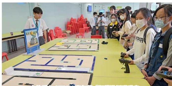
本校愛心 STEAM 嘉年華「相撲激鬥碰碰車」