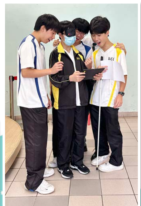
同學參加關愛共融體驗日，學習建立同理心及關愛他人的精神。