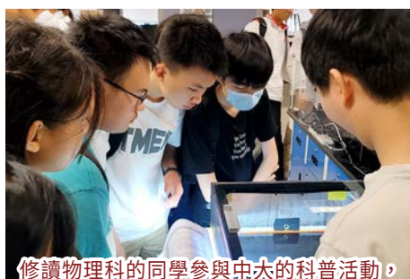
修讀物理科的同學參與中大的科普活動， 利用酒精雲霧室(cloud chamber)裝置， 觀察宇宙射線經由酒精蒸氣所產生的軌跡。