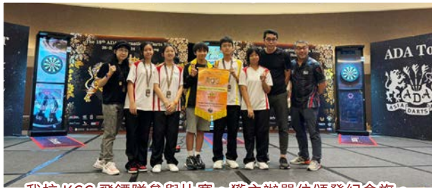
我校 KCC 飛鏢隊參與比賽，獲主辦單位頒發紀念旗。