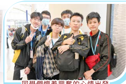
同學們懷着興奮的心情出發