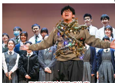
聖誕班際英語歌唱比賽