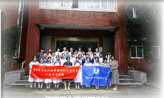
與蘇州大學老師交流