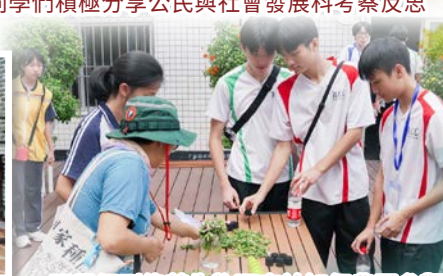
同學們到綠芽生物研究社知行農園參觀