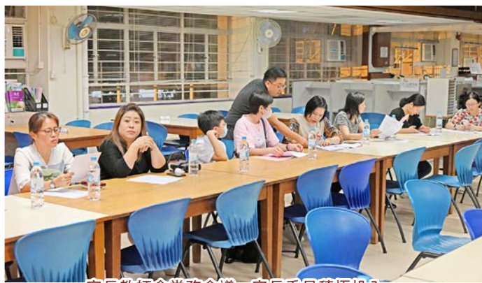
家長教師會常務會議，家長委員積極投入。