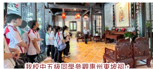
我校中五級同學參觀惠州東坡祠，專心聆聽導賞員講解。