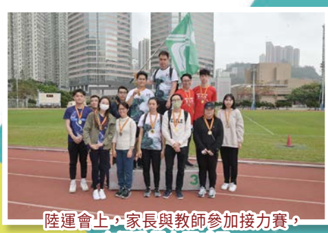
陸運會上，家長與教師參加接力賽，在運動場上顯威風。