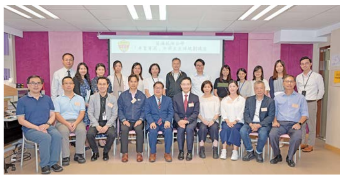
「卓育菁莪」嘉賓大合照