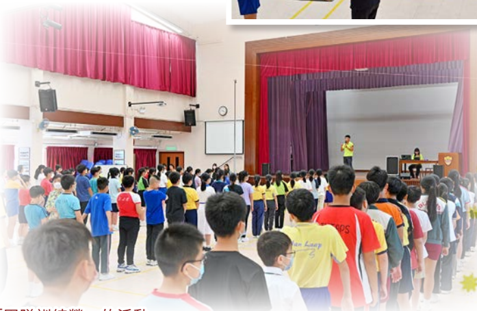
同學積極參與中一「團隊訓練營」的活動