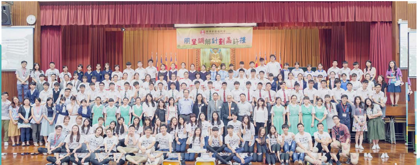
朋輩調解計劃嘉許禮

為延續校園的和平氣氛，學校與香港家庭福利會合辦「朋輩調解計劃」，幫助學生學習以和平方法排解同學之間的糾紛。由高年級同學擔任和平使者，協助同學以理智的方法處理衝突，締造和諧校園文化。中一學生在適應校園新生活時，學習互相尊重的精神，至為重要。