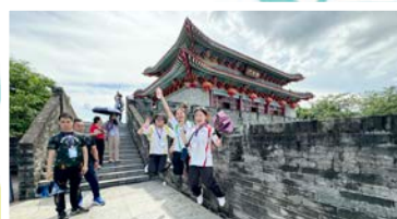
同學們能登上京門甚是興奮