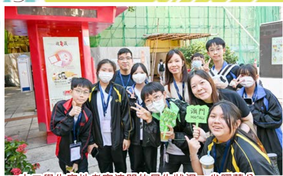
中二學生實地考察澳門的民生狀況，雀躍萬分。