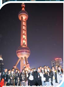
同學們夜遊黃埔外灘