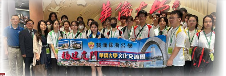
高中同學前往華僑大學了解其學科及收生要求