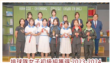
排球隊女子初級組獲得 2023-2024 學界比賽亞軍殊榮