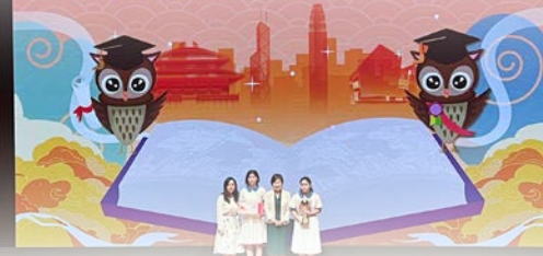
本校基本法大使積極籌辦國民教育及基本法活動獲得嘉許