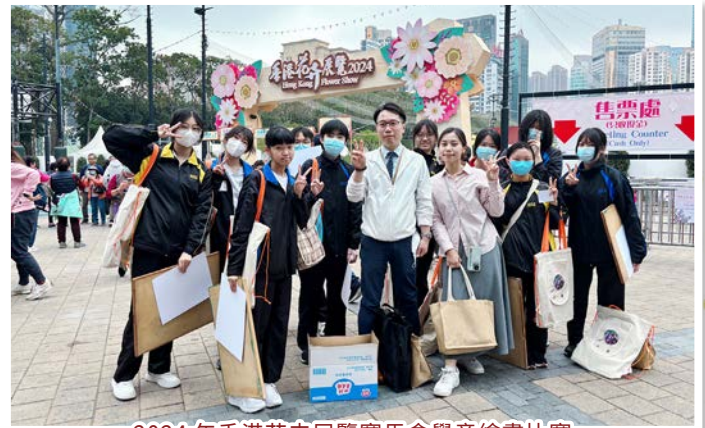
2024 年香港花卉展覽賽馬會學童繪畫比賽