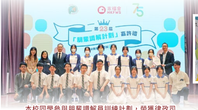
本校同學參與朋輩調解員訓練計劃，榮獲律政司司長林定國資深大律師頒發證書。