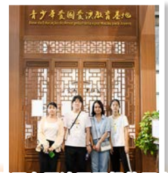
學習有關澳門回歸的歷史

從交流團中，學生除了學習兩地的歷史文化外，亦了解到香港、珠海及澳門的協作發展及其帶來的機遇。