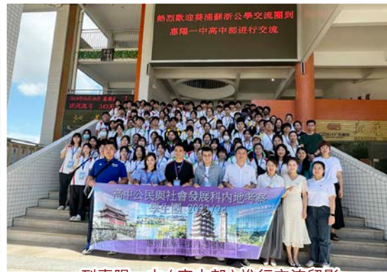
到惠陽一中（高中部）進行交流留影