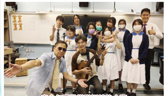
青少年眾樂隊訓練後合照