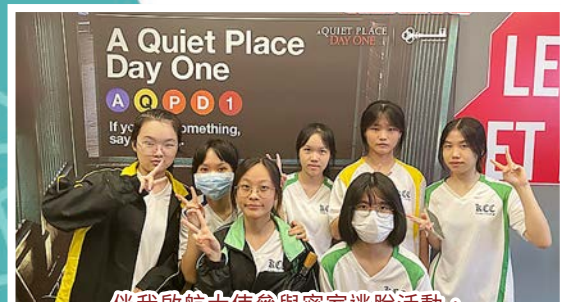
伴我啟航大使參與密室逃脫活動，提升勇氣及培養解難能力。