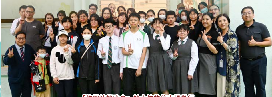
「校園燒烤晚會」於本校的停車場舉行