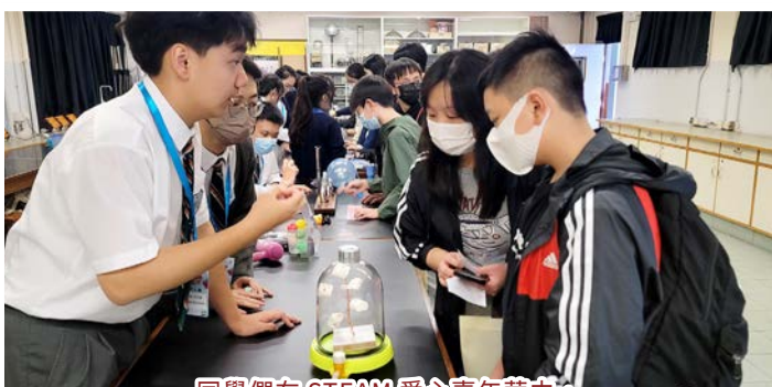
同學們在 STEAM 愛心嘉年華中， 利用棉花糖向來賓講解波義耳定律。