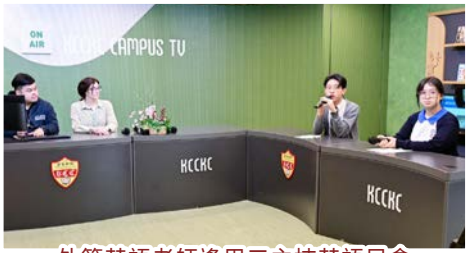
外籍英語老師逢周三主持英語早會

學校特意加強學生英語能力的培養，提升他們的英語水平。得辦學團體的支持，學校每年增聘額外四名外籍英語教師（兩名全職和兩名兼職），以增強學生運用英語的信心，並加強他們的英語