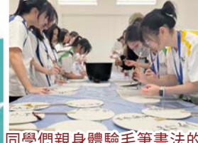
同學們親身體驗毛筆書法的神韻和雅致化交流活動帶來的樂趣