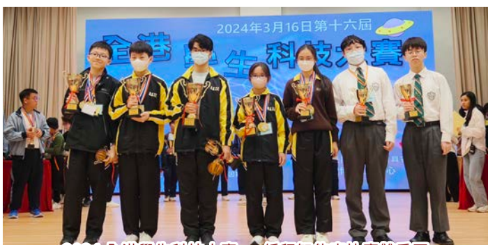
2024 全港學生科技大賽 — 編程智能車比賽雙季軍