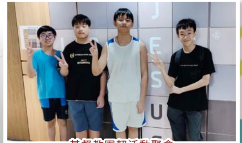
基督教團契活動聚會