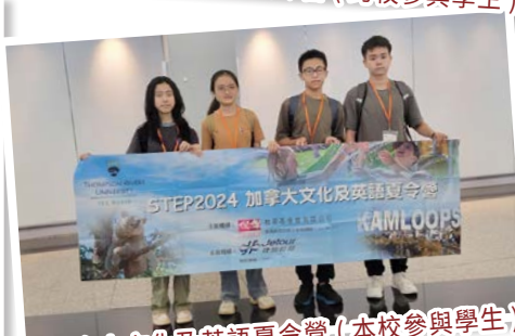
加拿大文化及英語夏令營(本校參與學生)