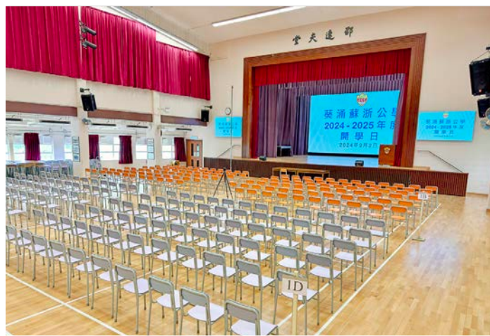
新禮堂 LED 牆為舞台表演背景提供更多變化效果