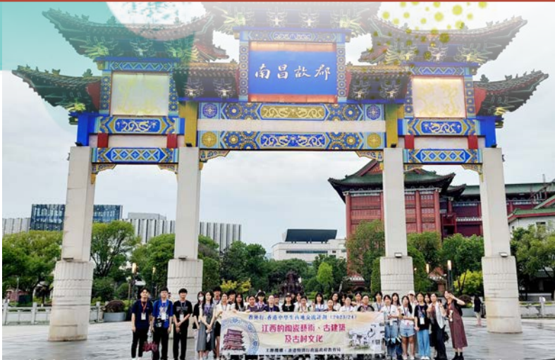
視藝科與地理科合作《江西的陶瓷藝術、古建築及古村探索文化》交流團