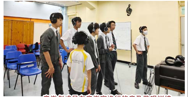
音樂劇成員在音樂室進行錄音及歌唱訓練