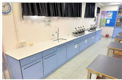
生物實驗室翻新工程