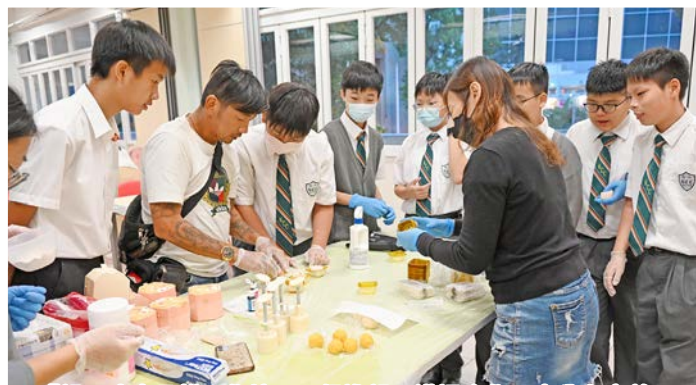
「親子冰皮月餅工作坊」，促進親子溝通合作，十分有意義。