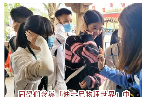
同學們參與「迪士尼物理世界」中 有關聲波的有趣實驗