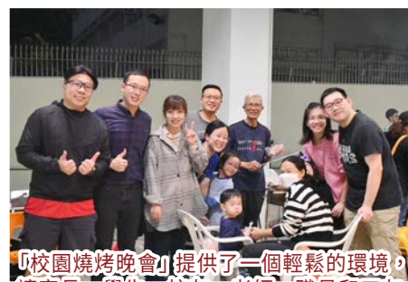
「校園燒烤晚會」提供了一個輕鬆的環境，讓家長、學生、校友、老師、職員和工友們一起享受美食和歡樂時光，促進交流和互動，加深對學校的歸屬感。