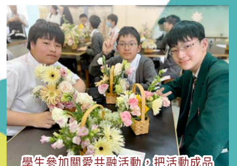
學生參加關愛共融活動，把活動成品送給家長或照顧者，以培養孝親、珍惜、感恩的正向價值觀。