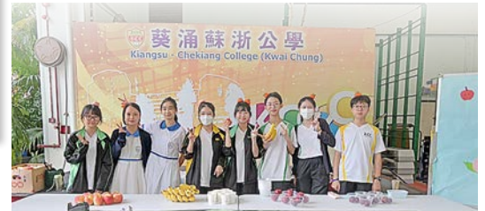
同學擔任學生會幹事，策劃多項活動。