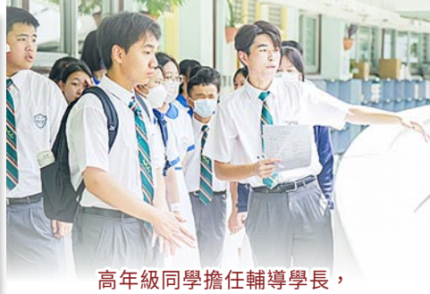
高年級同學擔任輔導學長，協助新生投入學校生活。