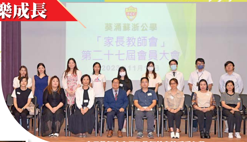
家長教師會家長及教師幹事接受委任狀

家長教師會是學校和家長之間的一道重要溝通橋樑，能夠有效促進彼此的認識和加強相互支持。每年，家長教師會都會舉辦多項充滿趣味和意義的活動，讓家長和學生一同參與。這些活動的舉辦不僅建立了互助和信任的關係，也讓學生看到父母熱衷參與學校活動的榜樣。這激勵學生更積極地參與校內外的學習活動，並促使他們在健康快樂的環境中成長。