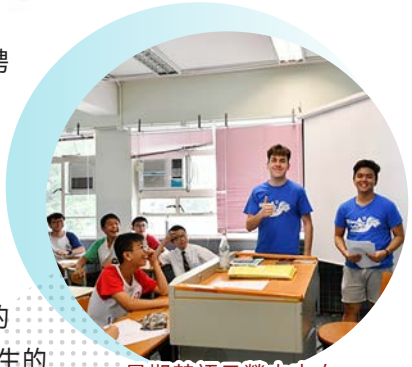
暑期英語日營由來自英國的外籍老師教授

語讀、寫、聽、說能力。高年級的英語授課亦以分組教學模式進行，減低師生比例，增加教學效能。此外，學校持續舉辦多項英語課程，包括「暑期中一級英語銜接課程」、「暑期初中英語日營」、「星期六初中英語課程」，以及針對高中不同能力學生舉辦的暑期補課計劃和 DSE 能力提升課程，全方位去增強學生的英語運用能力和應試能力。