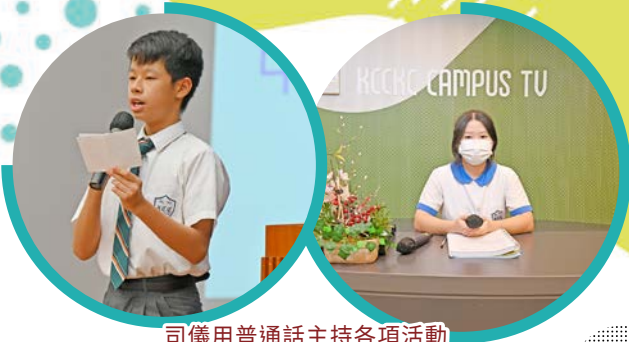
司儀用普通話主持各項活動

本科積極推動跨科組合作，提供更多元的發展機會，鼓勵同學積極參與校內外活動和比賽——朗誦、廣播劇、配音比賽、戲劇欣賞、工作坊等，啟發多元潛能，讓同學各展所長。本科重視營造普通話語言環境，讓同學開闊視野。除了讓普通話司儀主持早會、週會、各項活動及典禮外，本科更鼓勵同學參加公開考試，如 GAPSK 普通話水平考試，大多數同學取得 A 等成績；參加國家語言文字工作委員會普通話水平測試，全數達到本地普通話科教師語文能力要求，大多數獲得一級乙等成績，為升學及就業裝備自己。