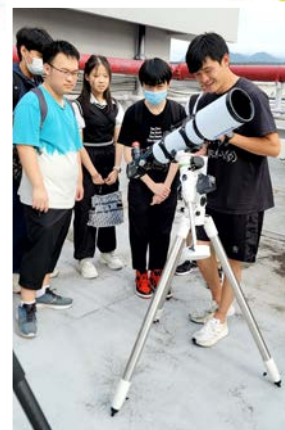
修讀物理科的學生參與中大的 科普活動，學習利用天文 望遠鏡觀察星體