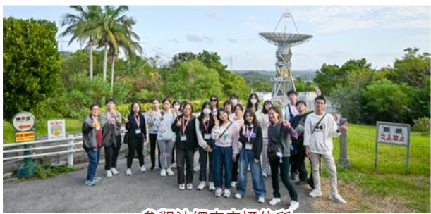
參觀沖繩宇宙通信所