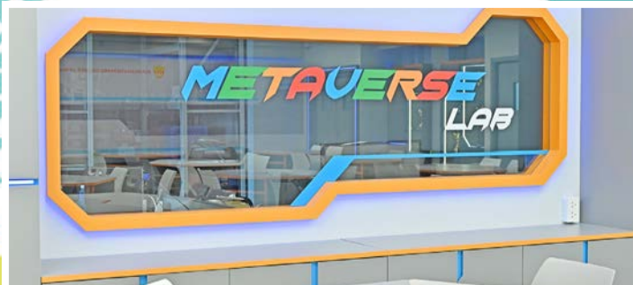
充滿未來科技感的 Metaverse Lab