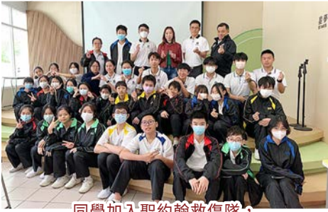
同學加入聖約翰救傷隊，學習急救技巧，日後回饋社會。

學校為同學提供多元發展機會，並致力啟發同學的領導才能。同學透過領袖生工作和各種訓練與服務，得以發展潛能及培養領袖素質。