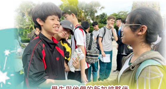
學生與他們的新加坡夥伴