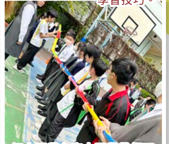
初中同學在高中同學帶領下，以有趣活動促進適應校園生活的能力