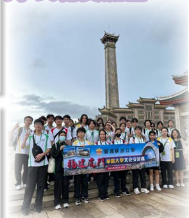
遊覽鰲園、集美學村及陳嘉庚先生故居